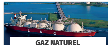
GAZ NATUREL LIQUÉFIÉ