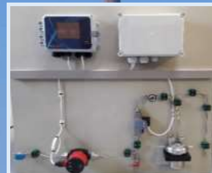
Platine de mesure eaux chaudes