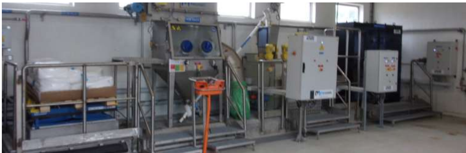
Chaîne automatisée complète de préparation et de distribution de flocculant en poudre