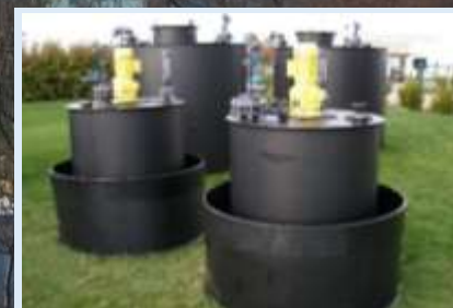
Cuves avec agitateur pour le traitement de rejets hospitaliers