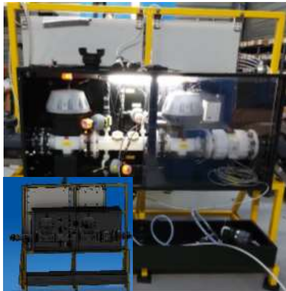
Skid de sécurisation de dépotage (BTS)