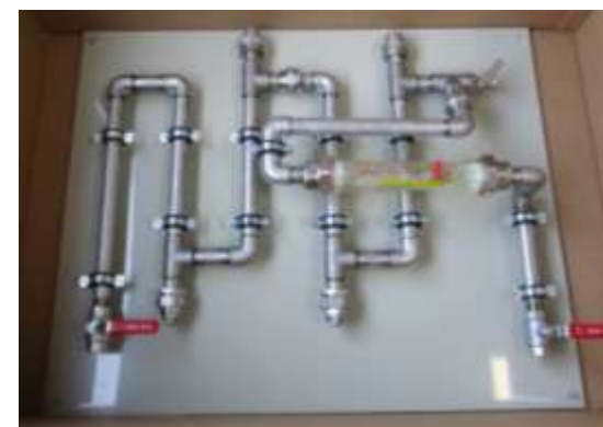
Rack de corrosion en inox