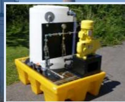
Skid de dosage 100bar pour chaudière