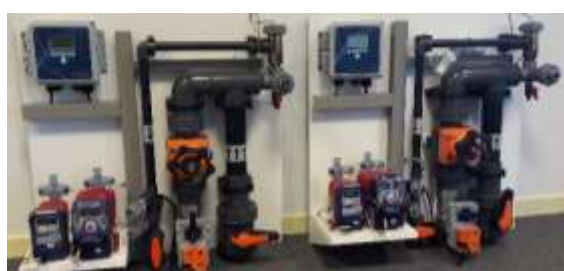
Fabrication en petite ou moyenne série