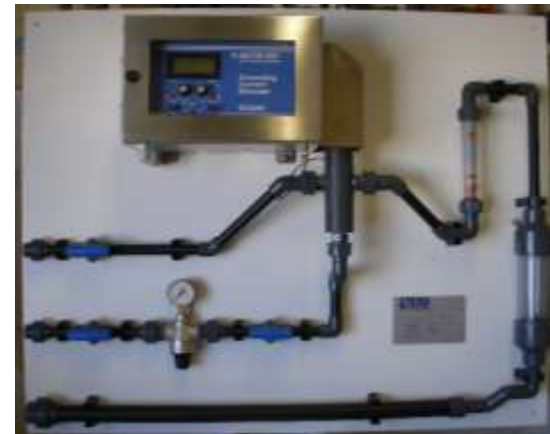
Analyseur SCD pour régulation flocculation