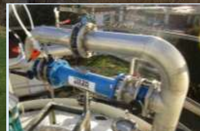
Mélangeur statique pour la neutralisation en ligne de NEP