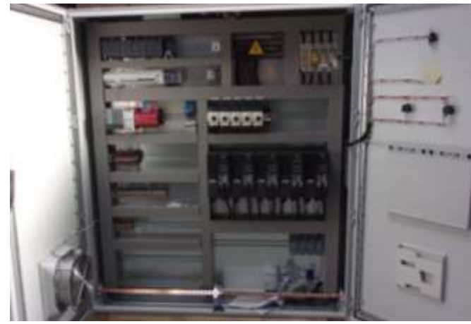
Armoire de commande de pompes en milieu industriel