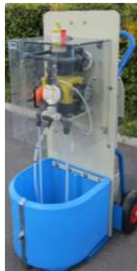
Skid mobile de dosage