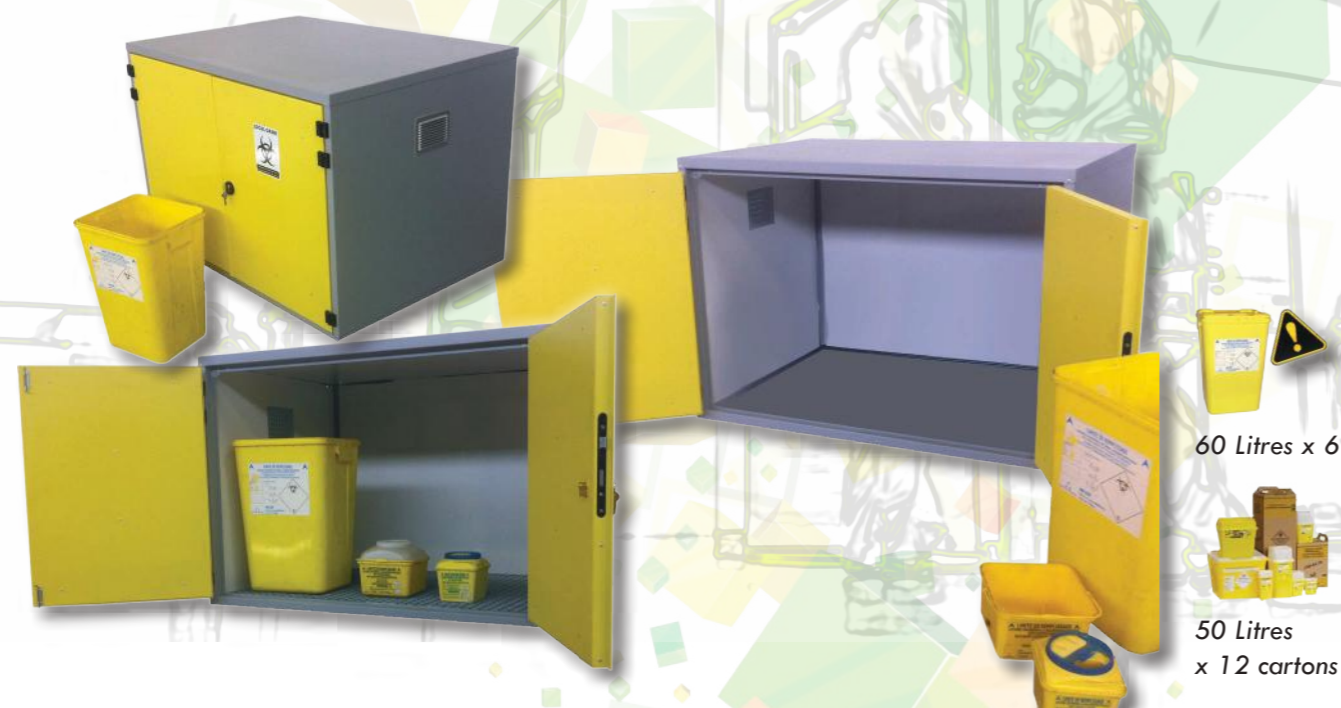
60 Litres x 6

Local d'entreposage temporaire pour DASRI