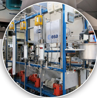
Maquette pour recyclage des eaux grises.

FIRMUS France est reconnu au titre du Crédit Impôt Recherche comme entreprise ayant la capacité de mener des Travaux de Recherche depuis 2012 et jusqu'en 2017.