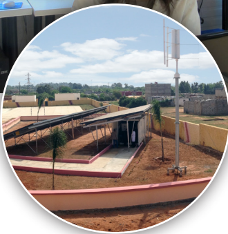
Unité de traitement d'eau de forage fonctionnant avec des énergies renouvelables.