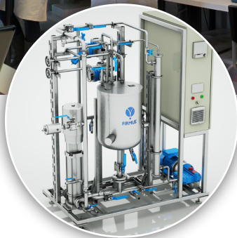
Pilote polyvalent Ultrafiltration, Nanofiltration, Osmose inverse