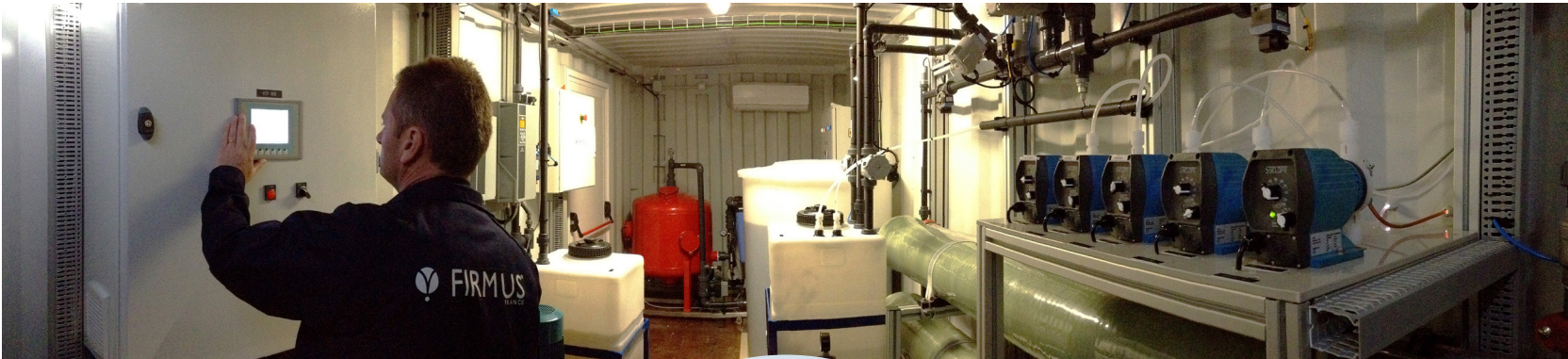
Container pour traitement de lixiviat (Capacité 120 m 3 /jour)

Spécialisée dans les traitements des eaux et des effluents pour le respect des normes de rejet ou leur recyclage, FIRMUS France travaille sur toutes les technologies actuelles disponibles et possède plus de vingt ans d'expérience dans les techniques membranaires.