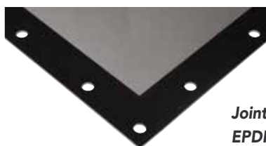
Joint large en EPDM noir (-40°+80°C)