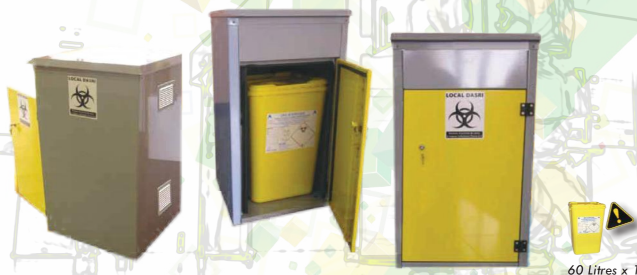
60 Litres x 1

Local d'entreposage temporaire pour DASRI