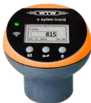
Oxitop®-IDS/B pour toutes les applications dont biogaz