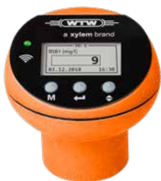
Oxitop®-IDS pour toutes les applications sauf biogaz

Le nouvel OxiTop®-IDS est un instrument de mesure moderne destiné à tous les types d'études respirométriques. La polyvalence de l'OxiTop®-IDS permet de réaliser n'importe quel examen, aérobie ou anaérobie. Toutes les têtes peuvent être utilisées indépendamment de tout appareil pour des mesures de DBO normales entre un et sept jours.