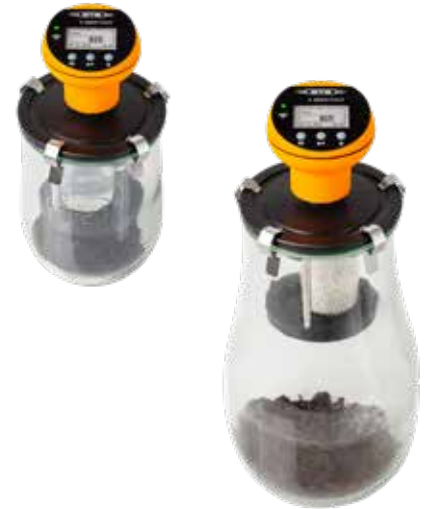
OxiTop®-IDS B6M 2.5 pour tests AT4