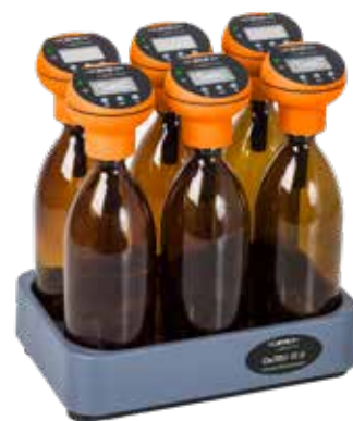
OxiTop®-IDS Set IS6

Toutes les mesures effectuées avec OxiTop®-IDS peuvent être enregistrées avec un programme d'acquisition de données (à télécharger sur www.wtw.com ) via le port USB de l'appareil de mesure.